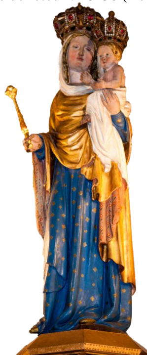
Photo de la statue de Notre-Dame -de-Bonne-Garde de Longpont-sur-Orge sur le site basilique-de-longpont.fr/decouvrir-la-basilique/notre-dame-de-bonne-garde

Horaire de retour : 18h30 (Heure estimée)