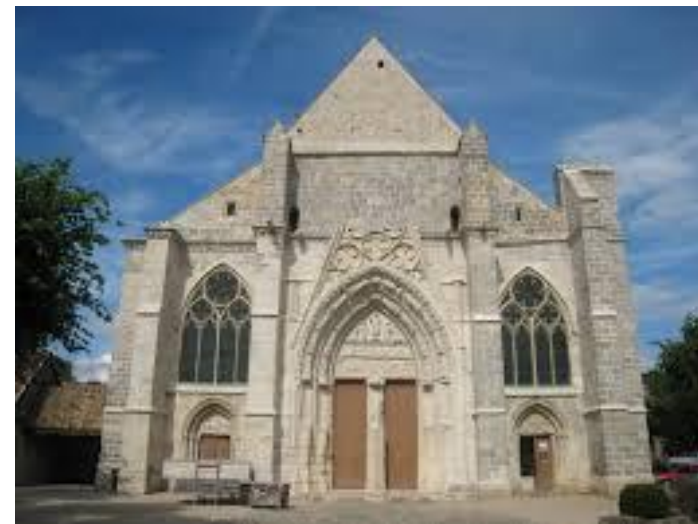
*Photo de l'église St Sulpice de Favières